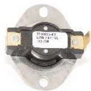
LIMITEUR HAUTE TEMPERATURE S-410 (250F)