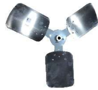
PALE DE VENTILATEUR (NOUVEAU 2021) S-1001A