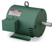
MOTEUR 1 HP (NOUVEAU 2021) S-1000A