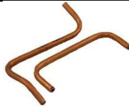
TUBES DE DETECTION D'AIR