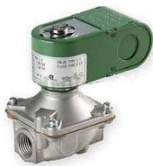
VALVE SOLENOIDE 1 ¼" S-1004